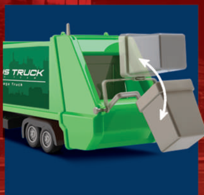
Levanta e abaixa a lixeira!

O caminhão de lixo vem com mecanismos que simulam o funcionamento real de coleta de lixo, como a possibilidade de levantar os compartimentos ou basculá-los para esvaziar o conteúdo. Já o caminhão baú é ideal para transportar tudo o que a imaginação permitir.