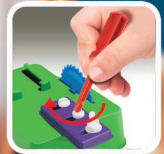
Parafusos e porcas para você apertar e soltar

*ATENÇÃO: O CAPACETE NÃO ACOMPANHA O PRODUTO