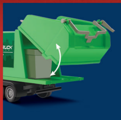
A traseira abre e fecha!