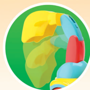
A PÁ SOBE E DESCE!