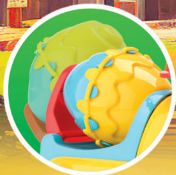
A BETONEIRA SOBE E DESCE, E GIRA!

CONSTRUA SONHOS E EXPLORE NOVOS CAMINHOS DESCOBRINDO O MUNDO DA CONSTRUÇÃO COM MUITA CRIATIVIDADE!